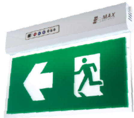
EXB 303 SCE / EXB 303 TCE Ceiling mount type