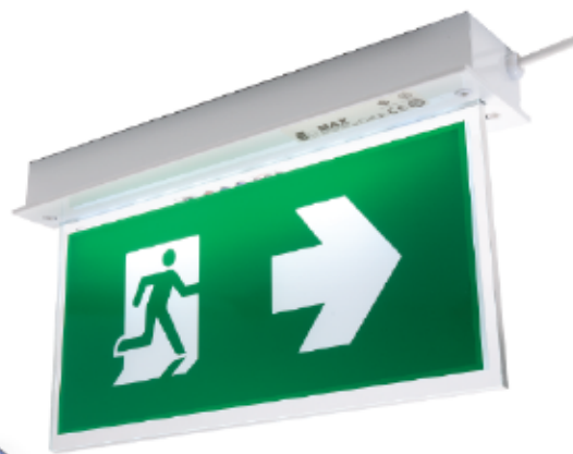
EXB 303 SRE / EXB 303 TRE Recess mount type